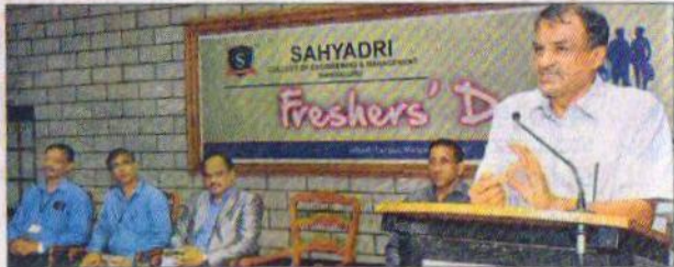
ಸಹ್ಯಾದ್ರಿ ಕಾಲೇಜಿನಲ್ಲಿ ಫ್ರೆಷರ್ಸ್ ಡೇ ನಡೆಯಿತು.

ಅವರು ಅನುಭವಗಳನ್ನು ಮತ್ತು ಸ್ವಾಮಿ ವಿವೇಕಾನಂದ, ಎಮಿಲಿ ಡ್ಯುರಾಂಟ್ ಹಾಗೂ ಬರ್ಟ್